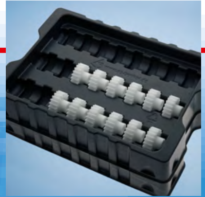
Tray für Transportschutz

Wir fertigen mit einem technologisch aktuellen Maschinenpark im Vakuumthermo-Verfahren. Präzision, Qualität und Effizienz sorgen für einen flüssigen Produktionsablauf zu Ihrer Zufriedenheit.