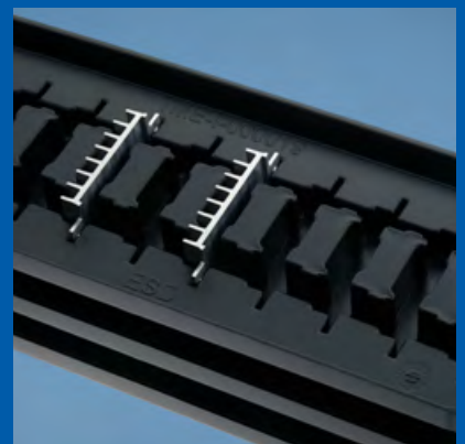
Ladungsträger für Automation